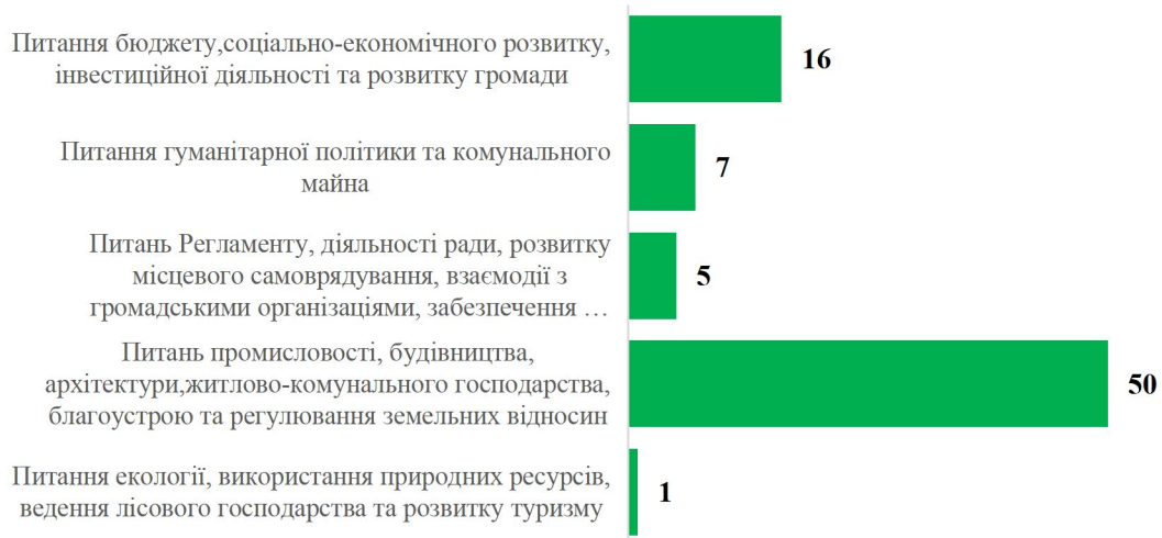
Рис.1.3. Кількість засідань постійних комісій Вигодської селищної ради за 2023 рік

Відповідно до статті 32 Закону України «Про засади державної регуляторної політики у сфері господарської діяльності» планування діяльності сільських, селищних, міських, районних у містах, районних та обласних рад з підготовки проектів регуляторних актів здійснюється в рамках підготовки та затвердження планів роботи відповідних рад у порядку, встановленому Законом України "Про місцеве самоврядування в Україні" та регламентами відповідних рад.